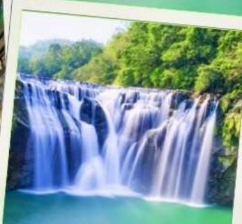
น้ำตกซือเฟิ่น