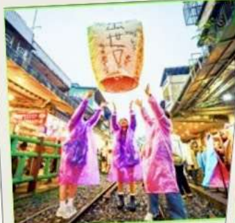
ปล่อยโคมลอย