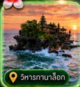
วิหารกานาล็อก