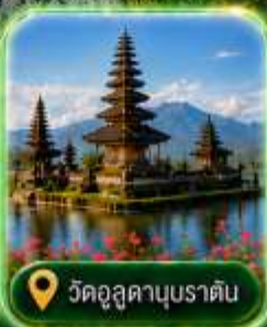
วัดอุสุคานูบราติน