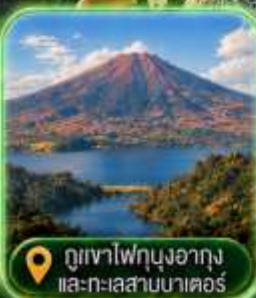
ภูเขาไฟบุงอากัง และทะเลสาบมาตอร์