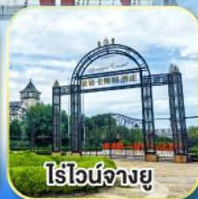
ไร์ไวน์จางยู