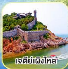
เจดีย์เฝิงไห่