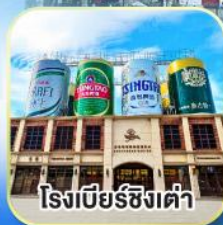
โรงเบียร์ซิงเต่า