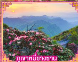
ภูเขาหมื่นช้างซาน