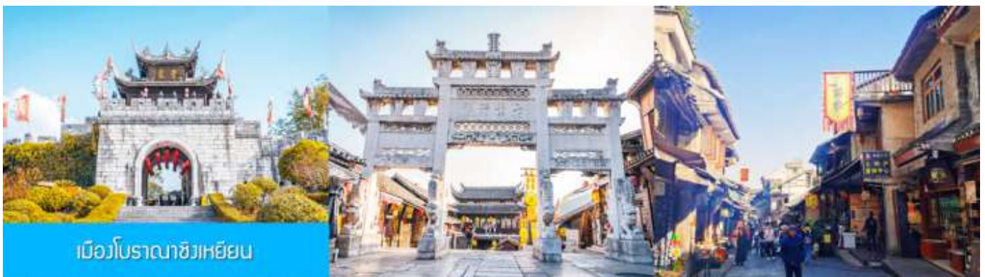
เมืองโบราณชิงเหยียน

เที่ยง รับประทานอาหารกลางวัน ณ ภัตตาคาร (มือที่ 8)