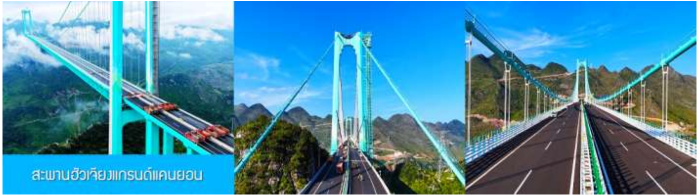
สะพานฮิวยวกรนด์แคบยอน

ไกด์นำเสนอ OPTIONAL TOUR แพคเกจเที่ยวชมตัวสะพาน รวมค่าบริการนั่งลิฟท์แก้วขึ้นสู่ชั้นชมวิวบนทาวเวอร์ รวมค่ารถรับส่งจากศูนย์บริการนักท่องเที่ยวสู่ตัวสะพาน รวมกาแฟบนหอคอยชมวิวท่านละ 1 แก้ว อัตราค่าบริการ 380 หยวนหรือ 1,900 บาทต่อท่าน