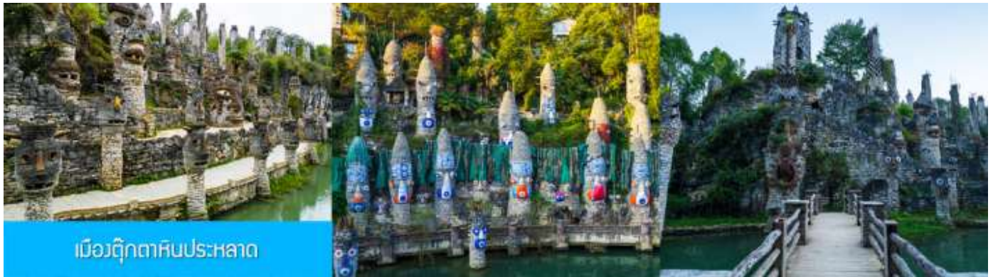
เมืองตุ๊กตาหินประหลาด

พักที่ MUSHAN / XUN QIAN JI HOTEL โรงแรมระดับ 4 ดาวท้องถิ่น หรือเทียบเท่าในอุทยาน