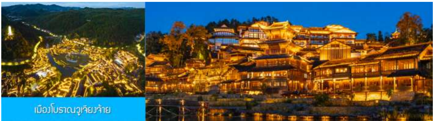
เมืองโบราณฮิวยวจ่าย

หลังอาหารนำท่านเที่ยวชม เมืองโบราณฮิวยวจ่าย 乌江寨景区 เป็นอุทยานท่องเที่ยวริมเมืองโบราณชนเผ่าเหมียว (ชนเผ่าม้ง) ที่ได้ชื่อว่ามีวิวกลางคืนที่สวยงามที่สุดของมณฑลกุ้ยโจว อุทยานนี้รวมไว้ซึ่งแหล่งท่องเที่ยว สถานที่ถ่ายทำภาพยนตร์ ร้านอาหาร รีสอร์ท ศูนย์ประชุม ด้วยทิวทัศน์ที่สวยงามกว่าหมื่นล้านหยวน สัมผัสบ้านเรือนโบราณของชนเผ่าเหมียว ซึ่งเป็นชนกลุ่มหลักที่พำนักในพื้นที่มานาน ปัจจุบันชนเผ่าเหมียวยังคงรักษาไว้ซึ่งขนบธรรมเนียมและวิถีชีวิตแบบดั้งเดิม ชมการแสดงพื้นเมือง และการละเล่นพื้นเมืองของชนกลุ่มน้อยต่างๆ ในช่วงหัวค่ำบ้านทุกหลังในอุทยานจะประดับด้วยแสงไฟที่งดงาม และมีการแสดงต่างๆ อาทิ การบิน โดรน น้ำพุ และการยิงแสงเลเซอร์ ฯลฯ (ค่าทัวร์รวมค่ารถรับส่งภายในเขตอุทยาน ค่าทัวร์ไม่รวมค่านั่งเรือแจวในเขตอุทยาน)