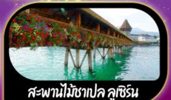
สะพานไม้ฆาปค คูซิริน