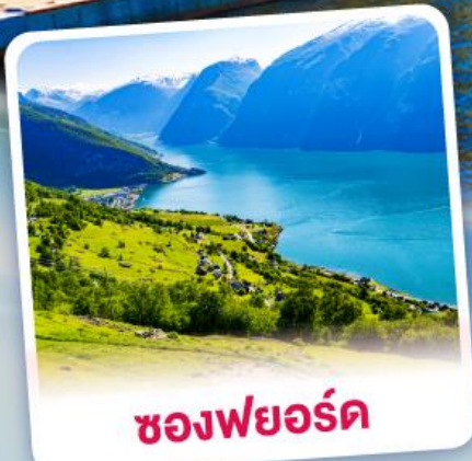
ช่องฟยอร์ด