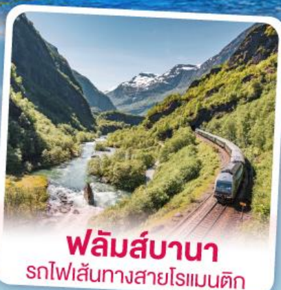
พลิมส์บานา รถไฟเส้นทางสายโรแมนติก