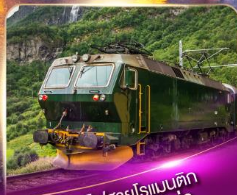
รถไฟสายโรแมนติก ฟลิ้มส์บาน่า