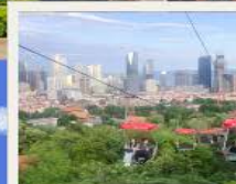
กระเช้าชมเมือง