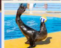
POLAR OCEAN PARK