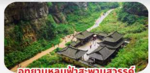
อุทยานหลุมฟ้าสะพานสวรรค์