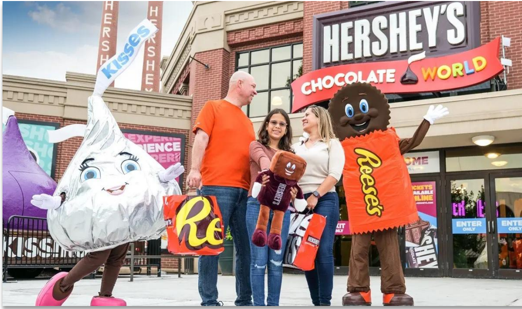
คำ บริการอาหารค่ำ ณ ภัตตาคาร

เข้าชมได้เนื่องจากเดินทางมาถึงล่าช้า บริษัทขอสงวนสิทธิ์ในการไม่คืนเงินหรือชดเชยใด ๆ ในทุกกรณี) ด้วย เครื่องจักรเก่าแก่และเทคนิคการผลิตช็อกโกแลตดั้งเดิมของ HERSHEY'S โรงงานก่อตั้งขึ้น ในปี ค.ศ. 1876 ในโรงงานแห่งนี้ยังมีผลิตภัณฑ์ยอดนิยมอย่าง Hershey's Crystal A ลูกอมคาราเมลรสนม ที่โด่งดังด้วยสโลแกน "Melt in Your Mouth" นำท่านออกเดินทางสู่ "กรุงวอชิงตัน ดี.ซี."