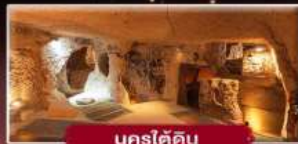
นครใต้ดิน