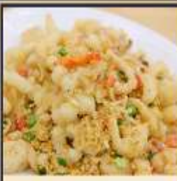
หมึกทอดกระเทียม