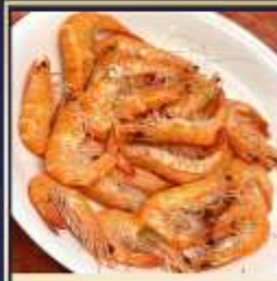
กุ้งหวานลวก