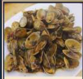
ผัดหอยลาย