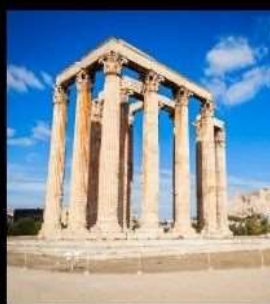
Temple Of Olympian