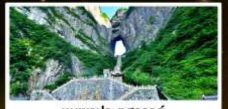
ทิวเขาประตูสวรรค์