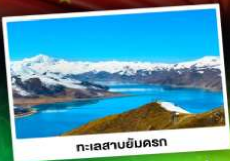
ทะเลสาบยี่นครก