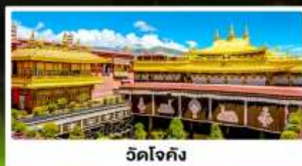
วัดโจกซัง