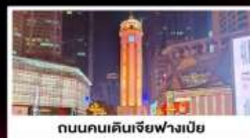
ถนนคนเดินเจี๋ยฟางเป็ย