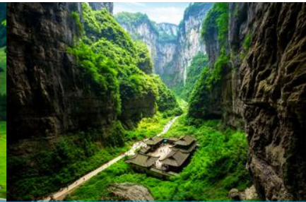
สะพานธรรมชาติสามแห่ง