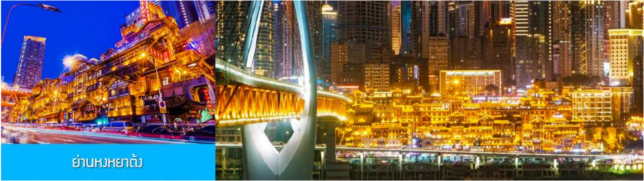
ย่านหงหยาดัว