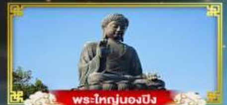
พระใหญ่ของปิง