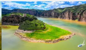
แกรนด์แคนยอนแม่น้ำเหลือง

*ทางบริษัทฯ ขอสงวนสิทธิ์ในการสลับโปรแกรมทัวร์ตามความเหมาะสมขึ้นอยู่กับสถานการณ์หน้างาน โดยคำนึงถึงผลประโยชน์ของลูกค้าเป็นสำคัญ