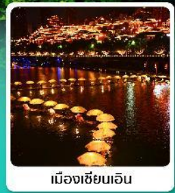
เมืองเซียนเอน

• โฮลท์ อุกยานเทียนเหมินซาน หุบเขาอวตาร เมืองโบราณเซียนเอน หมู่บ้านโบราณฟูรงจิ้น ภูเขาโรมาอู่จียโต อุกยานชื่อจื่อกวन्द่านสิงโต