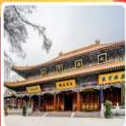
วัดต้าซิงซาน