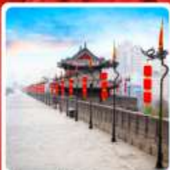
กำแพงเมืองโบราณซือาน