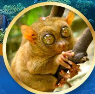
ลิงทาร์เซีย