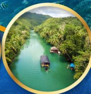
ล่องเรือแม่น้ำโลบ็อก