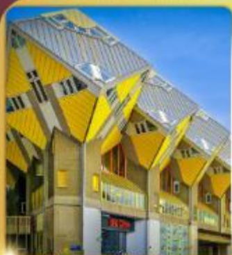
บ้านลูกเต่า โคกคูมูส

“ล่องเรือหลังคากระจก” ชมกรุงอัมสเตอร์ดัม