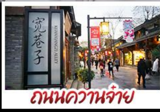
ถนนความจำ