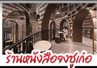
ร้านหนังสือจขูเก้อ

อุทยานภูเขาสี่ดรุณี อุทยานปี้เฟิงโกว หมู่แพนด้าอนเซลพี ร้านหนังสือจขูเก้อ วัดต้าฉือ ถนนโบราณความจำ ซ้อปิ้งย่านคิง ถนนไท่กู่หลี่ + ถนนซุนซู่ เมนูพิเศษ สุกี้หมาล่าเสวน