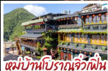
หมู่บ้านประมงจิ่วฝิ่น