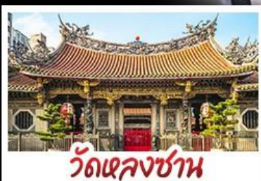
วัดเจหลงซาน