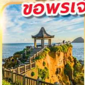
เกาะเหอผิง

พักย่านซีเหมินติง 2 คืน ขอพรเจ้าแม่กวนอิมพันมือ