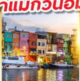
ท่าเรือประมงเจิ้งปิ่น