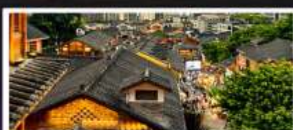
เมืองโบราณสือปาตี