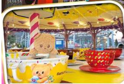
พลาดไม่ได้! BUTTERBEAR X FUJI-Q