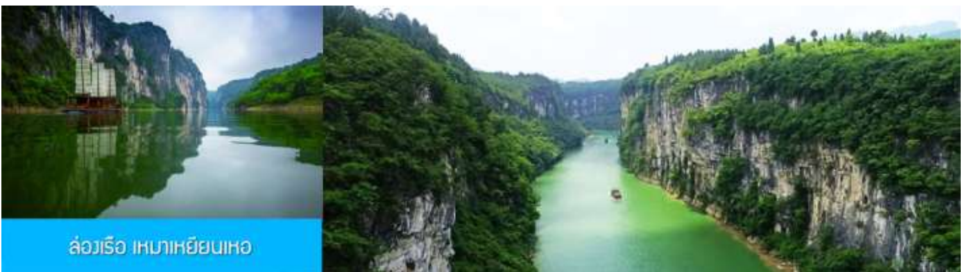
ล่องเรือ เหมาหยินเหอ