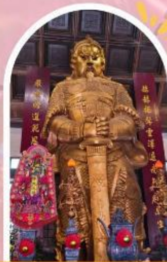
วัดแซกกง ขอพรโชคกลาง การเงิน และธุรกิจ