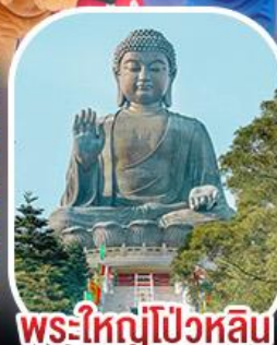
พระใหญ่โป้วหลิน