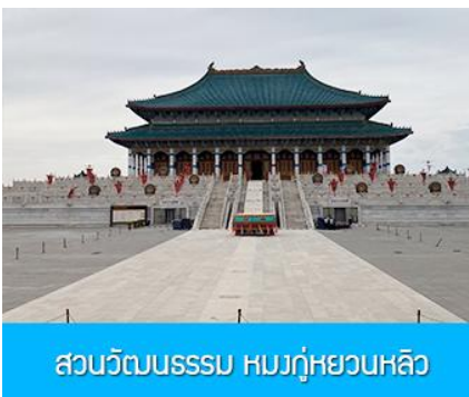
สวนวัฒนธรรม หมงกู่หยวน หลิว

หลังอาหารนำท่าน เที่ยวชม จวนอ๋องจวินหวี 郡王府 จวนแห่งนี้เริ่มสร้างขึ้นในปี ค.ศ. 1902 สร้างเสร็จในปี ค.ศ. 1936 เป็นที่พำนักของ อ๋องอิฉิจวินหวี 伊旗郡王 เป็นจวนอ๋องเพียงหนึ่งเดียวที่ได้รับการอนุรักษ์ในสภาพที่สมบูรณ์ โครงสร้างทำด้วยอิฐ หิน และไม้ ประกอบด้วยห้องพัก 16 ห้อง เป็นสถาปัตยกรรมผสมแบบมองโกล ทิเบต และฮั่น