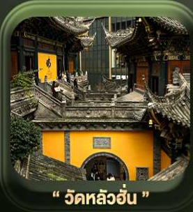
“ วัดหลิวอัน ”