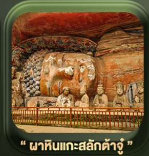
“ พาหินแเกาะสลักต้าจู้ ”