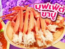
บุฟเฟ่ต์ ซาฮู