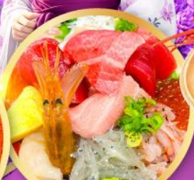
ตลาดปลาชิบิสึ คาชิโนะอิชิ