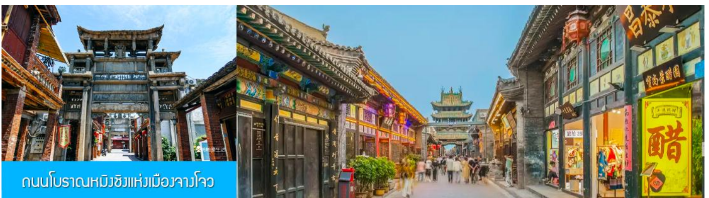
ถนนโบราณหมิงชิงแห่งเมืองจางโจว