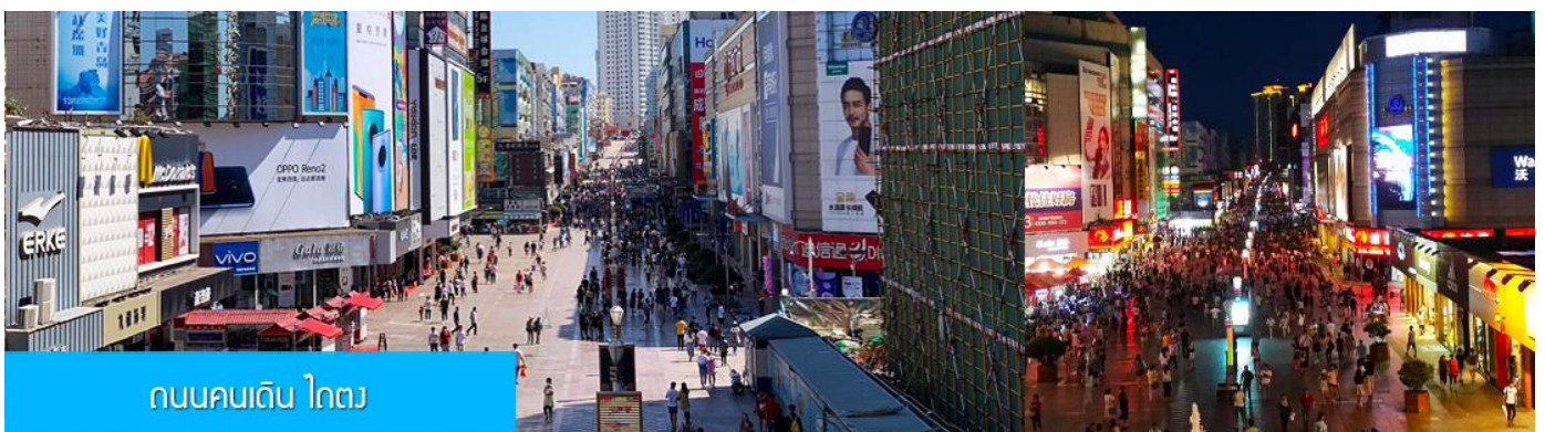
ถนนคนเดิน ไถตง

จากนั้นนำท่านเที่ยวชม โรงเบียร์ชิงเต่า 青岛啤酒博物馆 พิพิธภัณฑ์เบียร์ที่ขึ้นชื่อของเมืองชิงเต่า ซึ่งเป็นเบียร์ยี่ห้อแรกที่ผลิตขึ้นในประเทศจีน ชมเบียร์ คอลเลกชันที่มียี่ห้อหลากหลายที่สุดของโลก และชมการจัดแสดงภาพและวิดิทัศน์เกี่ยวกับวิวัฒนาการของเบียร์ ขั้นตอนการผลิตและอื่น ๆ ที่เกี่ยวข้อง พร้อมชิมเบียร์ชิงเต่า ซึ่งเป็นเบียร์ที่ขายดีที่สุดยี่ห้อหนึ่งของจีน.. (ชิมเบียร์ชิงเต่าท่านละ 1 แก้ว รับกลับอีก 1 ขวดเล็ก ตอนเดินออก)