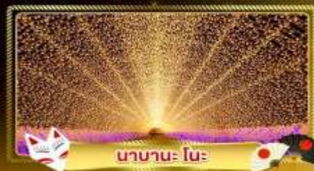
นานาะ โนะ