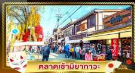
ตลาดซามิยากาวะ