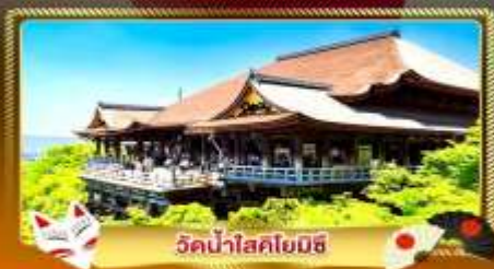
วัดน้ำสอโยมิชิ