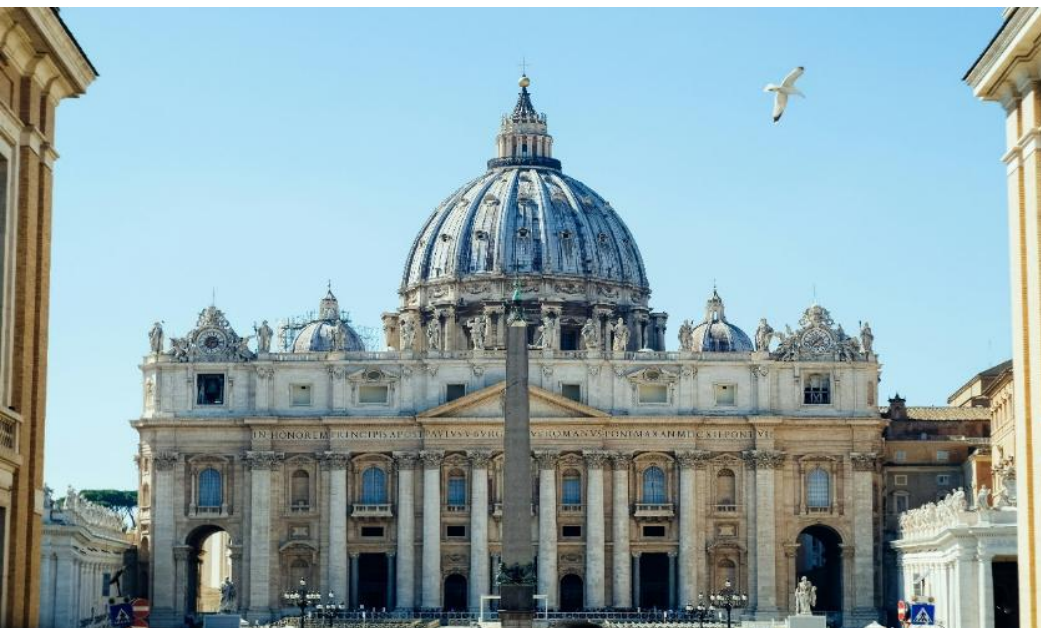
มหาวิหารนักบุญปีเตอร์ ( ST. PETER' BASILICA)

(กรณีมีพิธีด้านใน หรือถ้าหากมีผู้เข้าชมเป็นจำนวนมากจนไม่สามารถเข้าชมได้ทันเวลา ทั้งนี้เพื่อมิให้กระทบต่อกำหนดการท่องเที่ยวอื่นๆ ภายในโปรแกรมทัวร์" อาจจะไม่ได้รับการเข้าชม)