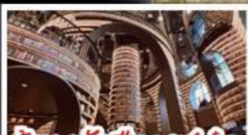
ร้านหนังกุ้งงูเก๋