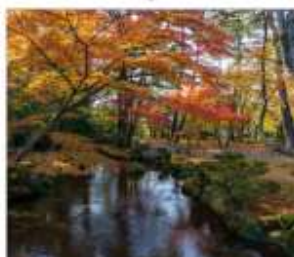
สวนเคนโระคุเอ็น