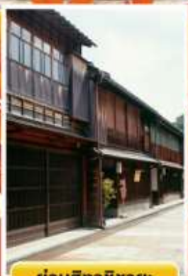
ย่านอิงาชิบายะ