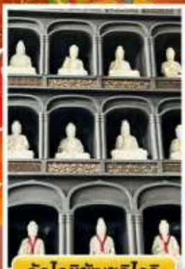
วัดโงชิซังเซอิโดจิ