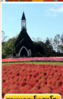
สวนบกกะโนะซาโตะ