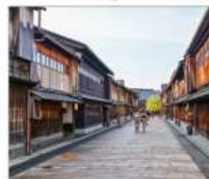
ย่านโรงน้ำชาอิงาชิซายะ