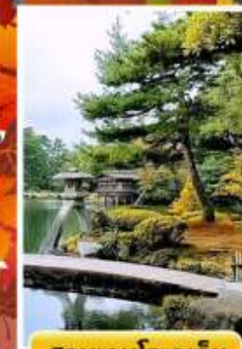
สวนเคนโระคุเอ็ง

🍷 ออนเซ็น 3 คั้น 🧳 นน.กระเป๋า 23 กก. ☀️ 7Days 5Night