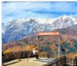
ฮาดุบะอิวาทาเกะ