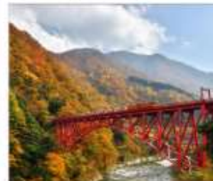
รถไฟชมวิวยุซุมเงาคุโรมะ