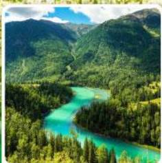
ทะเลสาบคานาสีอ