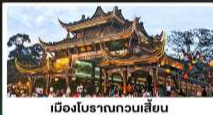
เมืองโบราณทวนเสียน