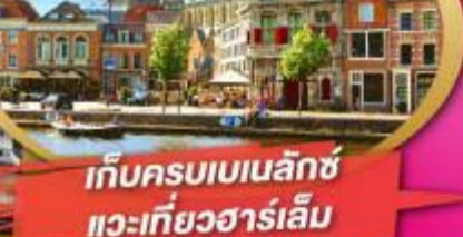
เก็บครบเบเนลักซ์ แวะเที่ยวฮาร์เล็ม