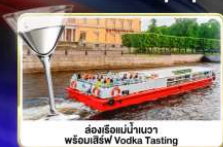
ล่องเรือแม่น้ำแคว พร้อมเสิร์ฟ Vodka Tasting