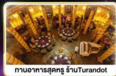
กานอาหารสุดหรู ร้านTurandot