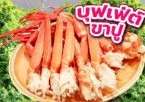
บุฟเฟ่ต์ ซาซุ