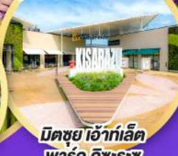
มิตซูบิ เอ้าท์เล็ต พาร์ค คิชะระชู