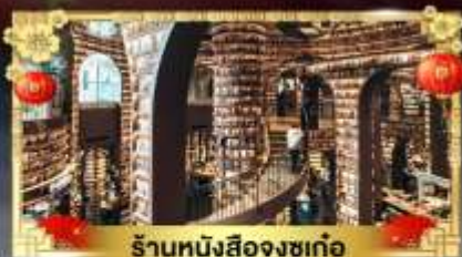
ร้านหนังสือจงซูเก๋อ