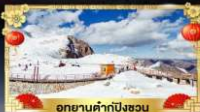
อุทยานคำกู่ปิงชวน