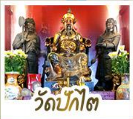
วัดปี้กโต