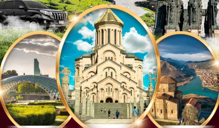
สะพานมิตรภาพ

*ราคาเริ่มต้น ไข่ - กลับ ต่อ 1 ท่าน เชื้อไขเป็นไปตามที่กำหนด